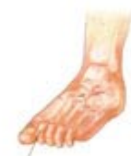
ORTEILS EN GRIFFE